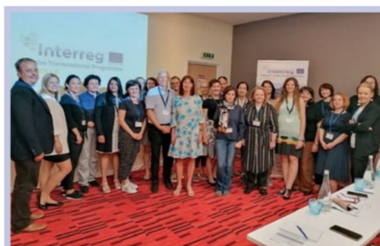
Partnerji projekta CD SKILLS

Več o projektu si lahko preberete na spletni strani projekta: https://www.interreg-danube.eu/approved-projects/cd-skills