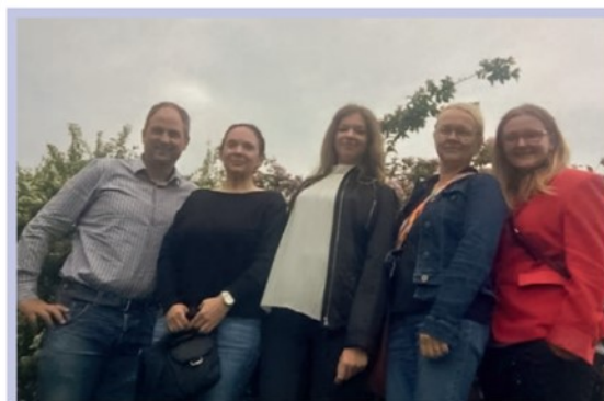
Predstavniki slovenskih partnerjev, UKC Maribor in MOM