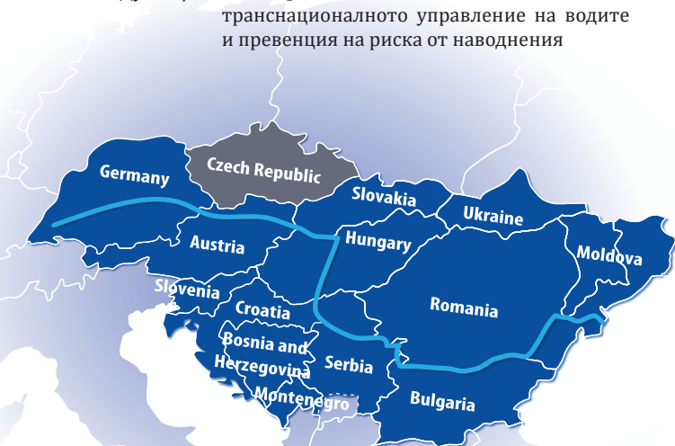
Транснационална Програма Дунавски Регион (Басейн на р. Дунав) ■ Обхват на проект SIMONA

Приоритет: Дунавски регион - отговорен към околната среда и културата Специфична цел: Подпомагане на транснационалното управление на водите и превенция на риска от наводнения