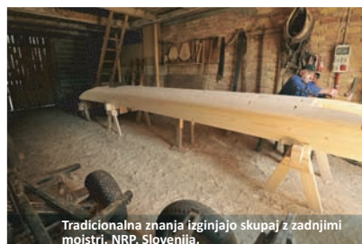
Tradicionalna znanja izginjajo skupaj z zadnjimi mojstri. NRP, Slovenija.

Prispevati k varovanju, ohranjanju in trajnostni rabi kraških ekosistemov v Podonavju in Dinaridih z ozaveščanjem o ekosistemskih storitvah in spodbujanjem naravi prijaznega podjetništva na krajevni ravni.