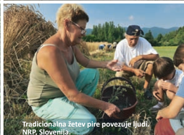
Tradicionalna žetev pire povezuje ljudi. NRP, Slovenija.