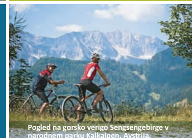
Pogled na gorsko verigo Sengengebirge v narodnem parku Kalkalpen. Avstrija.

Za projektne sodelavce s posameznih pilotnih območij so organizirana številna usposabljanja, da bi kar najučinkoviteje sodelovali z deležniki in dosegli kar najboljše rezultate. Izbrani deležniki s pilotnih območij so bili povabljeni na ekskurzijo v avstrijski narodni park Kalkalpen, kjer so spoznali primere dobre prakse sonaravnega podjetništva. V okviru projekta bodo ustanovljene lokalne in mednarodne mreže deležnikov.