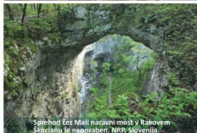
Sprehod čez Mali naravni most v Rakovem Škocjanu je nepozaben. NRP, Slovenija.