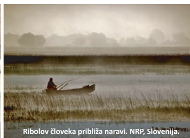
Ribolov človeka približa naravi. NRP, Slovenija.