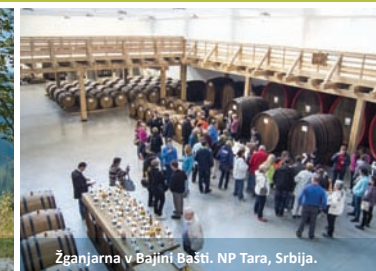
Žganjarna v Bajini Bašti. NP Tara, Srbija.