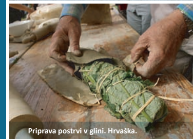
Prilava postrvi v glini. Hrvaška.

Kartiranje, ocenjevanje in vrednotenje ekosistemskih storitev na vseh sedmih pilotnih območjih opravljamo na podlagi prilagojenih metodologij, ki so bile razvite v okviru najnovejših znanstvenih študij.