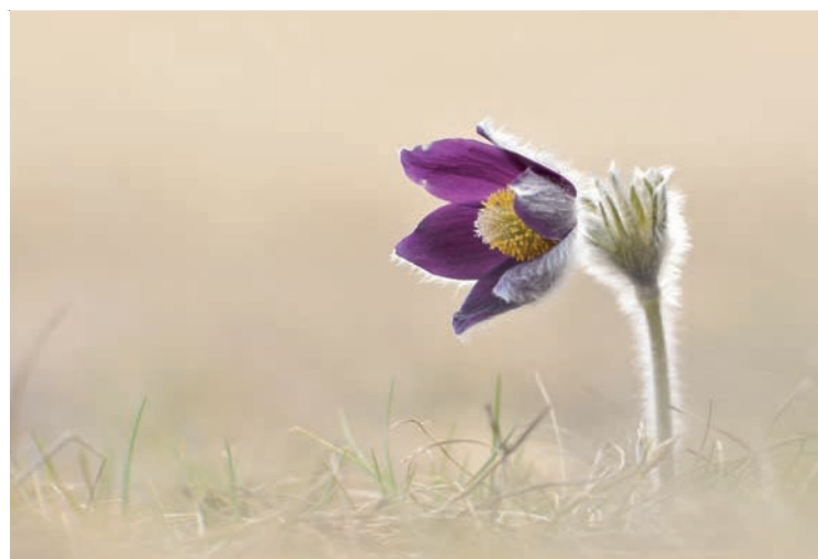
Gorski kosmatinec ( Pulsatilla montana ) zacveti le na suhih kraških travnikih. NRP, Slovenija.

Sodelovanje deležnikov pri upravljanju zavarovanih območij je temeljni pristop projekta. Deležniki so izbrani na podlagi vnaprejšnje proučitve njihove vloge na tem področju.