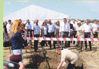
Praktické ukážky správy kapilárnej vody v pôde pripravili pracovníci Katedry strojov a výrobných biosystémov TF

Prehliadku pestovania plodín zameranú na prezentáciu rôznych spôsobov ochrany a výživy rastlín, doplnenú o výstavu poľnohospodárskej techniky a hospodárskych zvierat otvoril predseda vlády SR Robert Fico. Ako uviedol, ľudia pracujúci v poľnohospodárstve robia pre Slovensko veľa a zaslúžia si našu úctu. Účast-