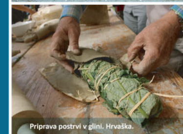
Priprava posrvi v glini. Hrvaška.