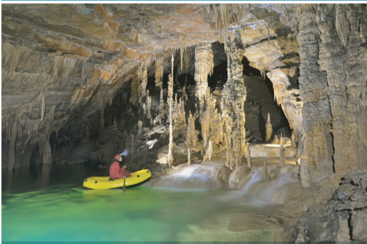
Jamar občuduje osupljivo arhitekturo Križne jame. NRP, Slovenija.

Kartiranje, ocenjevanje in vrednotenje ekosistemskih storitev na vseh sedmih pilotnih območjih opravljamo na podlagi prilagojenih metodologij, ki so bile razvite v okviru najnovejših znanstvenih študij.