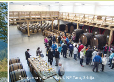
Zganjarna v Bajini Bašti. NP Tara, Srbija.