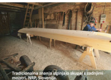
Tradicionalna znanja izginjajo skupaj z zadnjimi mojstri. NRP, Slovenija.

Prispevati k varovanju, ohranjanju in trajnostni rabi kraških ekosistemov v Podonavju in Dinaridih z ozaveščanjem o ekosistemskih storitvah in spodbujanjem sonaravnega podjetništva na krajevni ravni.