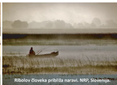
Ribolov človeka približa naravi. NRP, Slovenija.