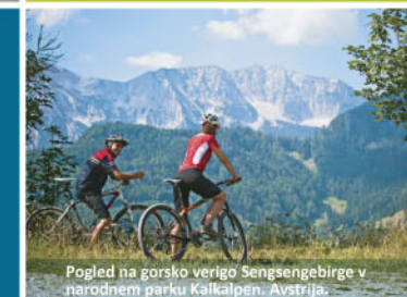
Pogled na gorsko verigo Sengsengebirge v narodnem parku Kalkalpen. Avstrija.

Projektnim sodelavcem bodo predstavljeni primeri dobrih praks sonaravnega podjetništva. Poleg tega bodo deležniki seznanjeni z novimi, naravi prijaznimi poslovnimi priložnostmi s podobnih območij v drugih državah.