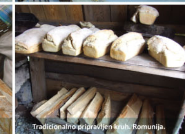
Tradicionalno pripravljen kruh. Romunija.