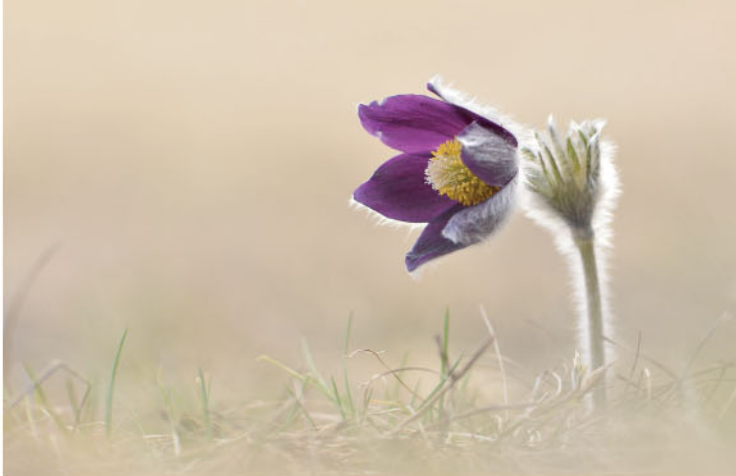
Gorski kosmatinec ( Pulsatilla montana ) zacveti le na suhih kraških travnikih. NRP, Slovenija.

Sodelovanje deležnikov pri načrtovanju upravljanja je temeljni pristop projekta. Deležniki so izbrani na podlagi vnaprejšnje proučitve njihove vloge na tem področju.