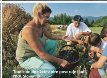
Tradicionalna žetev pira povezuje ljudi. NRP, Slovenija.