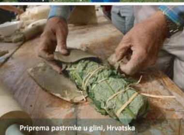
Priprema pastirmke u glini, Hrvatska