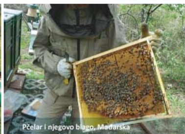
Pčelar i njegovo blago, Mađarska