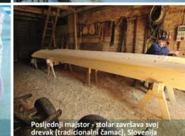
Posljednji majstor - stolar završava svoj drevak (tradicionalni čamac), Slovenija