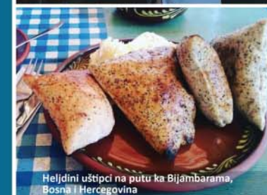
Heljđini uštipci na putu ka Bijambarama, Bosna i Hercegovina