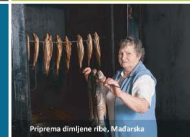
Priprema dimljene ribe, Mađarska

Na osnovu najboljih metodologija razvijenih u najnovijim naučnim istraživanjima, najprikladniji pristupi za mapiranje i procjenu usluga ekosistema biće prilagođeni i primijenjeni u svih sedam pilot područja.