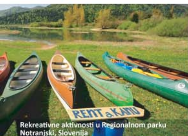
Rekreativne aktivnosti u Regionalnom parku Notranjski, Slovenija

Najbolji primjeri biodiverzitetskih poslova biće predstavljeni projektnim partnerima, a mogućnosti za nove biodiverzitetske poslove biće predstavljene zainteresovanim stranama iz sličnih područja širom svijeta.