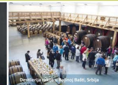
Destilacija rakiye u Bajinoj Bašti, Srbija