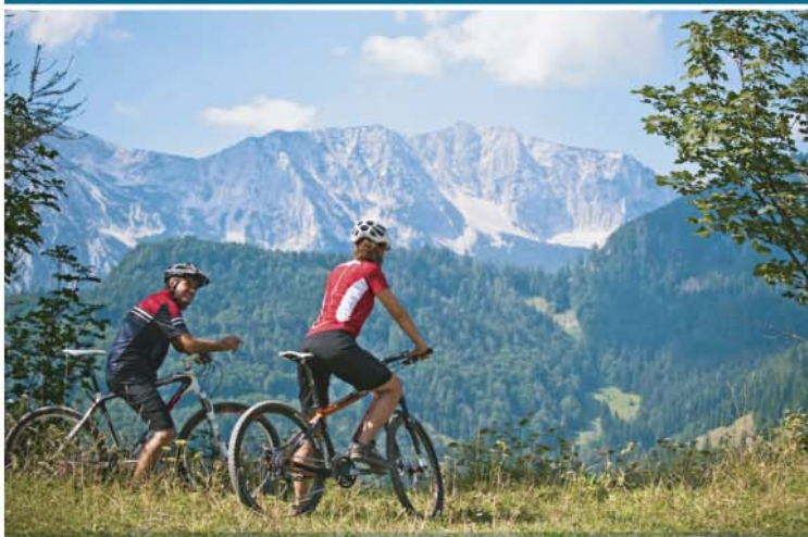
Pogled na planinski lanac Sengengebirge u Nacionalnom parku Kalkalpen, Austrija

Učešće je ključni pristup projekta, a zainteresovane strane su pažljivo identifikovane i analizirane. Zainteresovane strane koje predstavljaju širok spektar gledišta uključene su u sve glavne projektne aktivnosti.