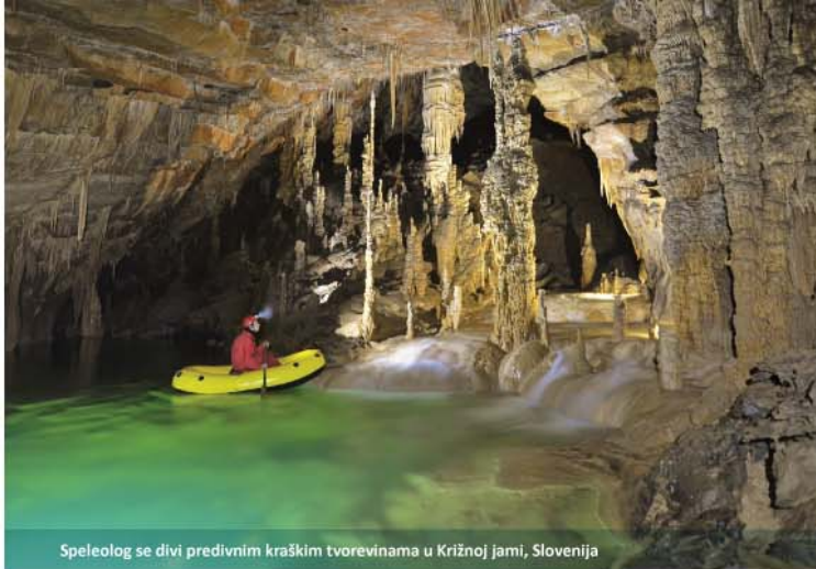
Speleolog se divi predivnim kraškim tvorevinama u Križnoj jami, Slovenija

Da doprinesemo zaštiti, očuvanju i održivom korišćenju kraških ekosistema u regionu Dinarida i basenu Dunava kroz podizanje svijesti o uslugama ekosistema i povećanju broja preduzetnika koji na održiv način koriste biološku raznovrsnost.