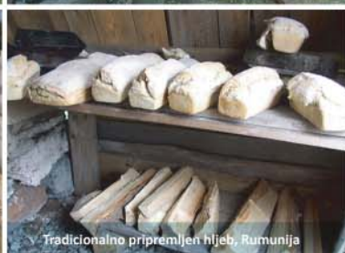
Tradicionalno pripremljen hleb, Rumunija